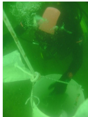
Ascensore per rifiuti