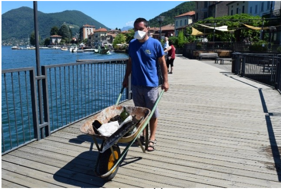
Verso lo smaltimento