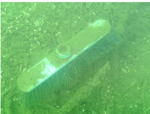
Un curioso rifiuto sommerso