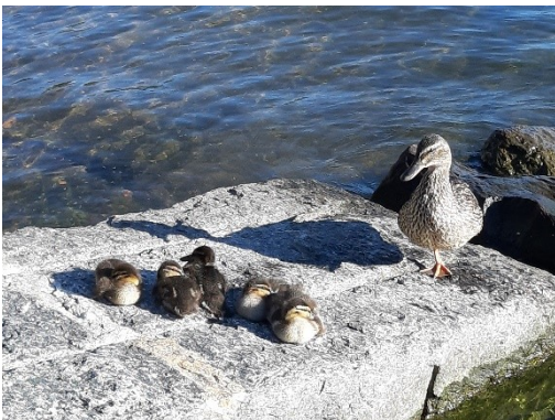
Segnali di speranza da Porto Ceresio