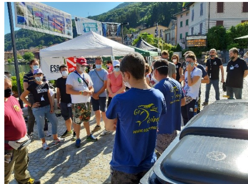
Alcuni volontari a BLU PULITO 2020