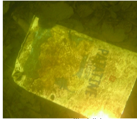
Un segno d'inciviltà