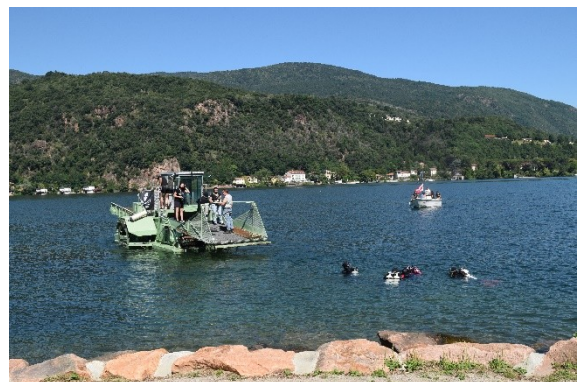
La draga dell'Autorità di Bacino a supporto dei sub